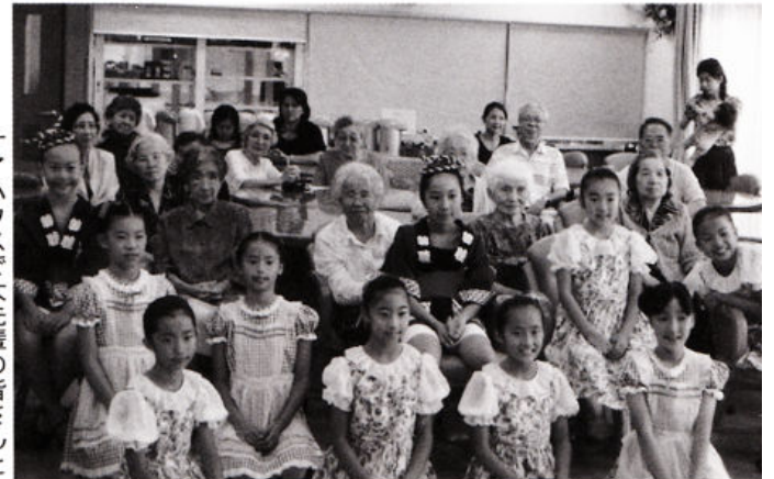
ケアハウスで大先輩の皆さんと

八代・本町アーケードで開催の町中活性化イベントに参加。また、ケアハウスも訪問しました。