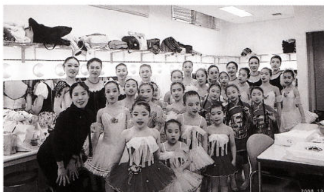
ステージを前に楽屋にて

ウィングまつばせで行われた「ウインターフェスティバルうきあかり」エリカバレエ教室のステージに八代教室研Cクラス・Cクラス11名が賛助出演、「こんぺい糖の精」と「花のワルツ」を踊りました。